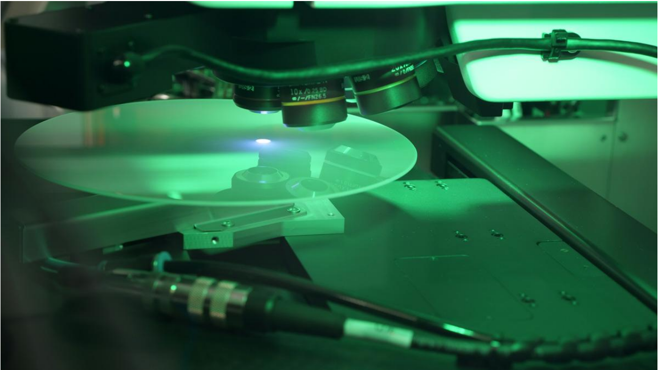
图1. MX系列工业显微镜下的蓝宝石晶圆。

工业显微镜有助于制造商满足LED生产的质量要求。对更高产量和可靠终端产品的需求推动了LED生产的持续改进过程。要实现在微型化方面的进步和功率密度的增加，需要这些改进。