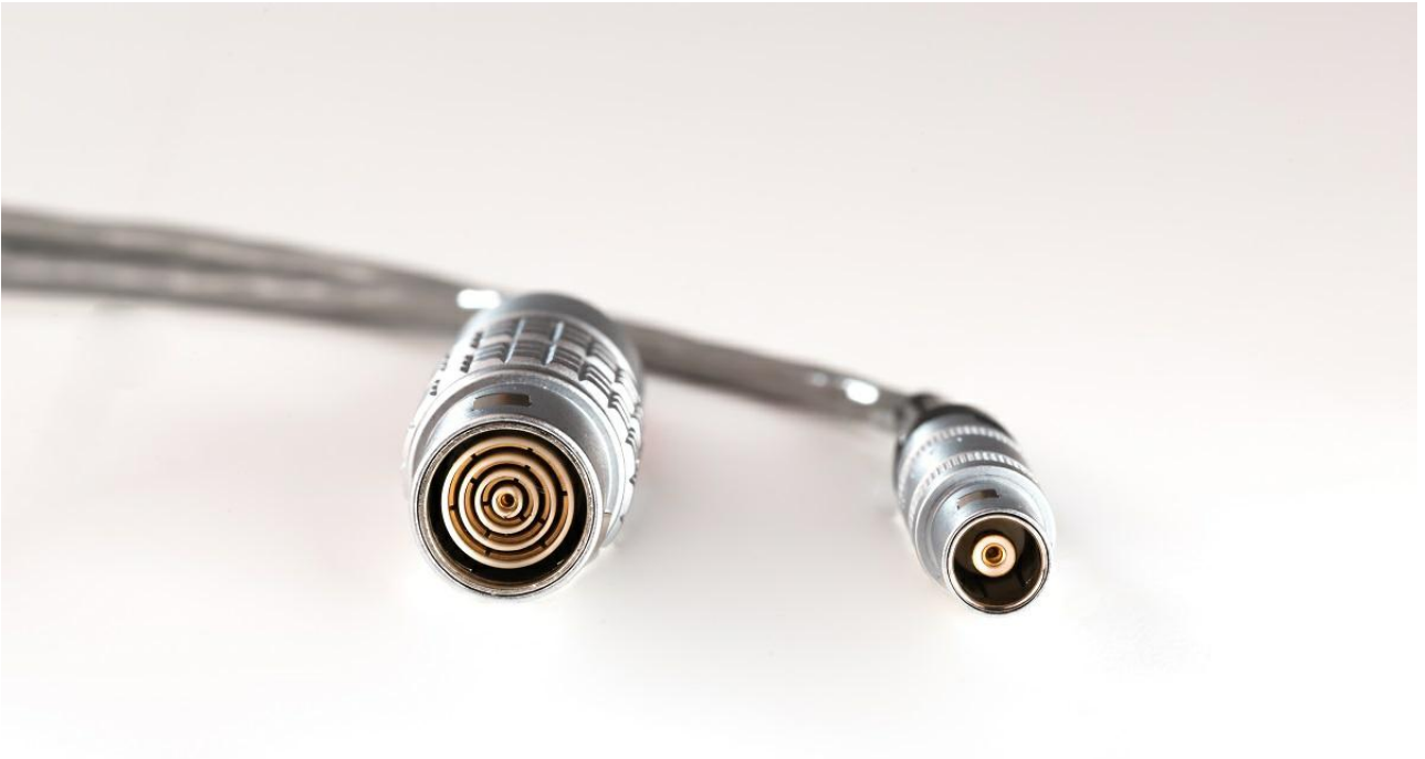
图3. LEMO同心接触连接器。

这种解决方案要求检测人员只旋转探头，而不是同时旋转探头和电缆组件。这种电缆不仅使用起来更加方便，而且性能出色，其电器噪声极小甚至没有。