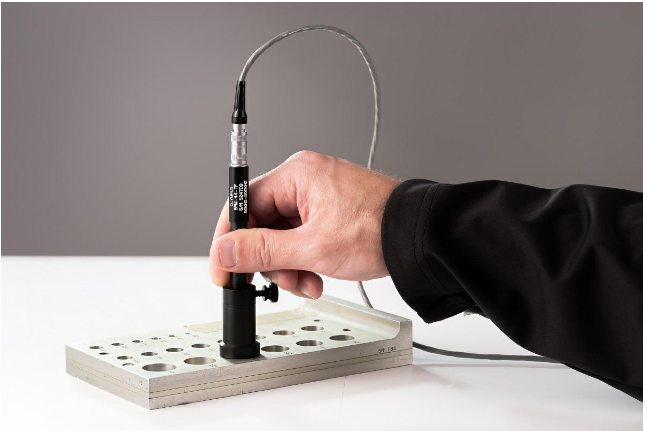
图4. 标准手动探头和电缆，显示了手动检测紧固件孔或螺栓孔时典型的电缆缠绕情况。