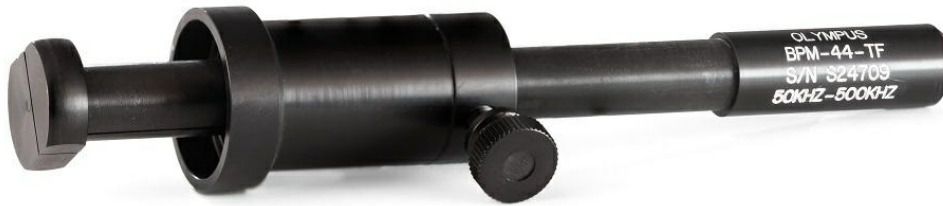
图2. 手动螺栓孔探头。

我们以航空航天紧固件孔的检测为例进行说明，这种检测的目的是探测延伸到内壁的各个方向上的裂纹。使用典型的手动螺栓孔或螺纹探头时，电缆必须与探头一起旋转才能进行检测。检测中如果需要多次旋转，可能会使电缆缠绕在一起，这种情况我们不愿意看到。电缆缠绕在一起会妨碍检测，并对电缆施加不必要的应力，从而导致设备出现故障。